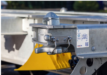
TWIST LOCKS mit Sicherung gegen Verdrehen an vier Paar Containerbalken als Standardverriegelung.

Verbesserte Technologie, optimiertes Handling und zusätzliche Funktionen machen die neue Generation Containerchassis zum langlebigen Partner für jede Transportaufgabe.