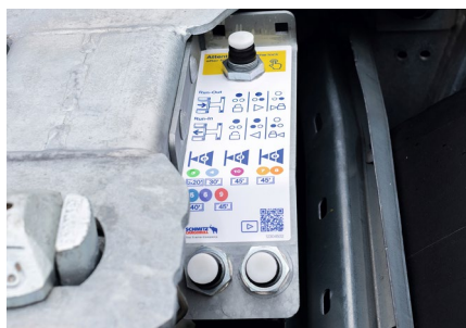
Steuerung für den pneumatischen Heckausschub , optional mit manueller Verriegelung.