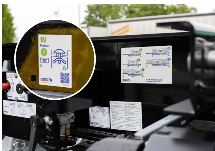
Neues Bedienkonzept mit Ladeplan und eindeutigen Funktions- und Warnhinweisen an Verriegelungen und Ausschüben.