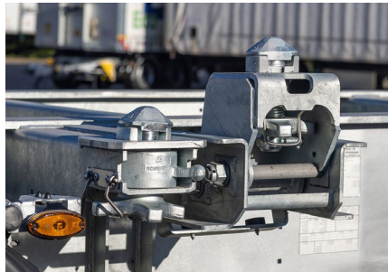
Bei 2 x 20' Beladungen übernimmt der höhenverstellbare KLAPP LOCK die Verriegelung des vorderen Containers.