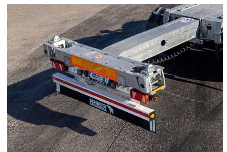
Neu: Der gedämpfte Heckausschub fährt pneumatisch die gewählte Verriegelungsposition an und bremst sanft ab.