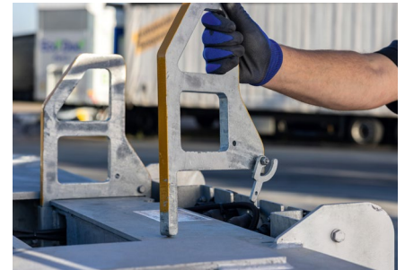
Leicht auswechselbare Containerführungen für Container am Frontbalken.